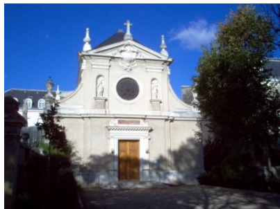
Chapelle Notre Dame de Bonne Délivrance