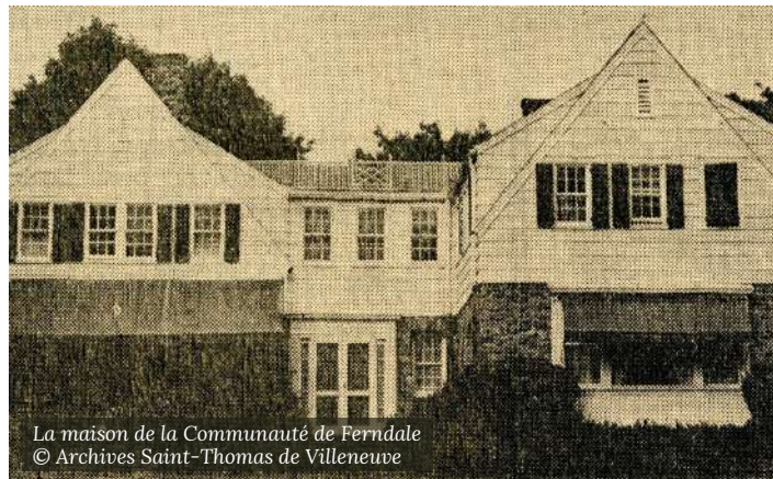
La maison de la Communauté de Ferndale

"...les Pères du Saint Esprit sont venus aux Etats-Unis en 1872 au nombre de 10. Ils ont fait un travail de géants. Dans l'Etat du Connecticut, à une centaine de kilomètres de New-York, à quelques kilomètres de la mer, dans un cadre idéal de verdure, ils ont défriché le terrain inculte et sauvage, fait sauter les énormes rochers, pour bâtir eux-mêmes le beau Séminaire des Missions qu'est S'Mary's Seminary à Ferndale-Norwalk. C'est là que nos premières religieuses missionnaires d'Amérique ont été appelées ;