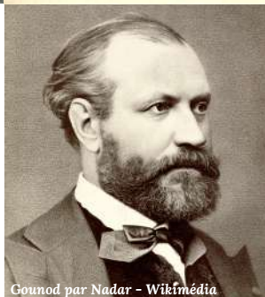
Gounod par Nadar - Wikimedia