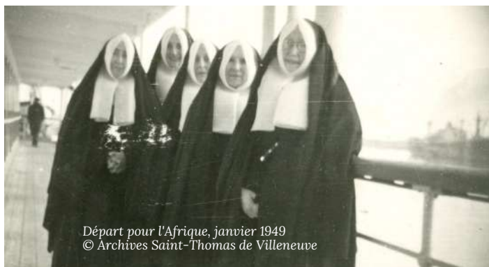
Départ pour l'Afrique, janvier 1949

Le départ des Sœurs pour l'Afrique est retardé par divers tracas administratifs.